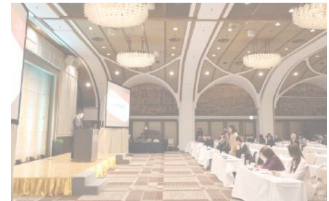
前回の審査会・表彰式